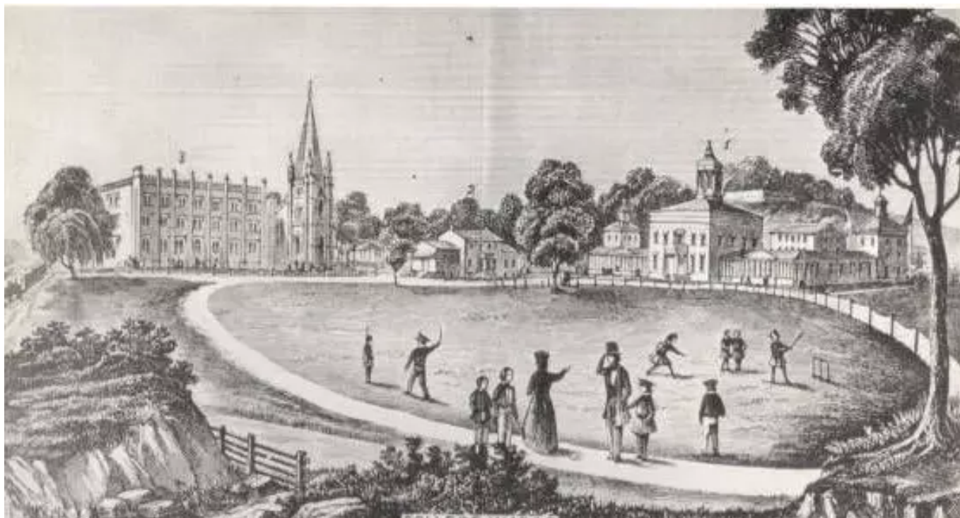
1846年的圣约翰学院（Fordham前身）

我于2009年至2015年在美国Fordham大学读博士。Fordham是美国众多普通大学之一，其哲学系也是美国众多普通哲学系之一。在这篇文章中，我将结合自己的经历，简单介绍一下Fordham及其哲学系的研究和教育状况，希望能让感兴趣的人对美国普通大学之普通哲学系多一点了解。